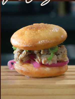
PAN BAO COCHINITA PIBIL