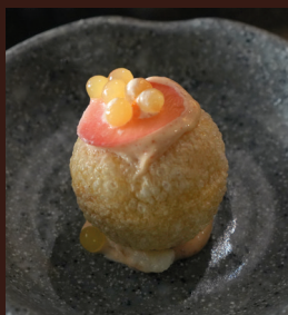
PANIPURI DE ENSALADILLA